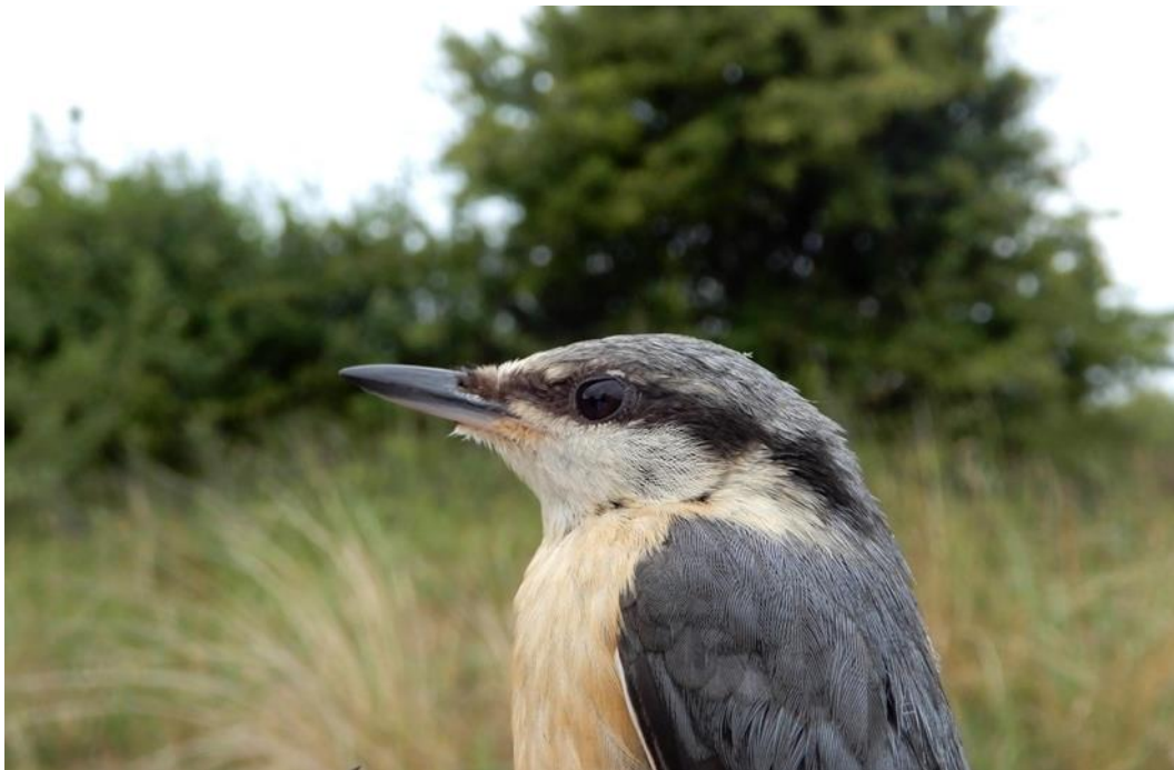
Boomklever