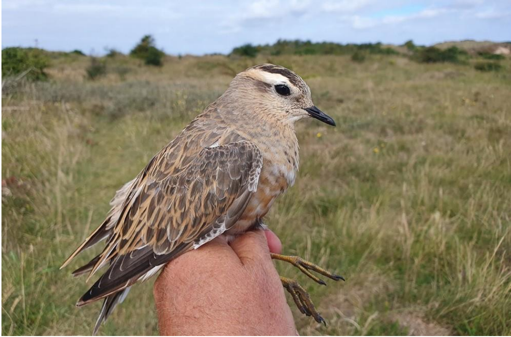
Morinelplevier; foto Arnold Wijker