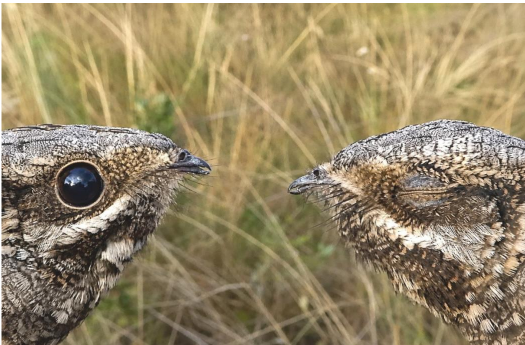
Nachtzwaluwen; foto Richard Reijnders