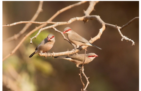
Black Rumped Waxbill - Napoleonnetjes