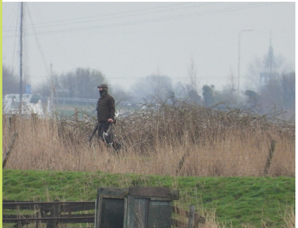
Jager met geschoten Grauwe Gans in de Dorregeestepolder.

We zoeken nog steeds urgent versterking voor de zwaar belaste werkgroep Ruimtelijke Ordening waar we - vaak op de langere termijn - veel dingen voor vogels kunnen betekenen.