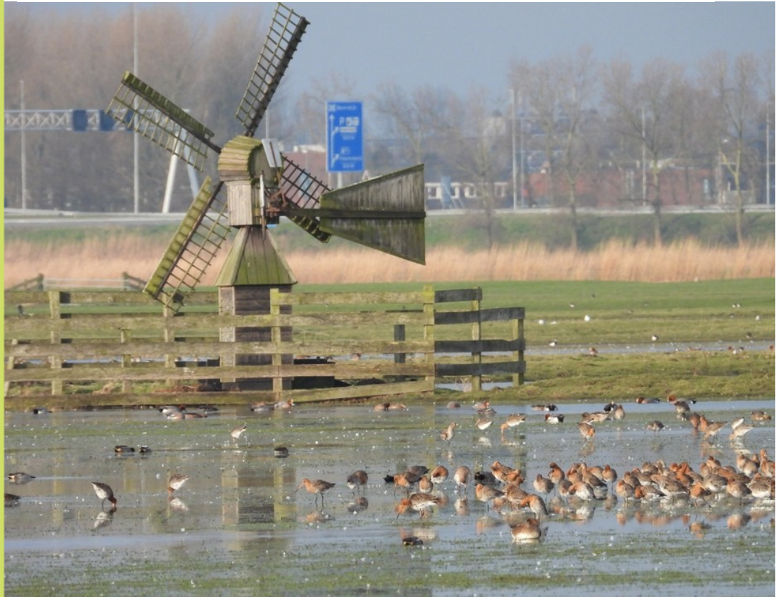
Grutto's bij Fort Krommeniedijk

De omstandigheden maakten het vogels kijken echter niet makkelijk. Een dichte koude mist hing over de velden, die de vogels grotendeels aan het zicht onttrok. Korte momenten van iets meer helderheid leverde gelukkig toch nog wel wat soorten op; we zagen een jagende Blauwe Kiekendiefman, Wulpen, Grutto's, Kieviten, Scholeksters, Tureluurs, Slobeenden en heel, heel veel Smienten (naar schatting meer dan 10.000). Aan het eind van de middag trok de mist uiteindelijk wat meer op en zagen we alsnog Kempaantjes en een dichtbij jagende Bruine Kiekendief.