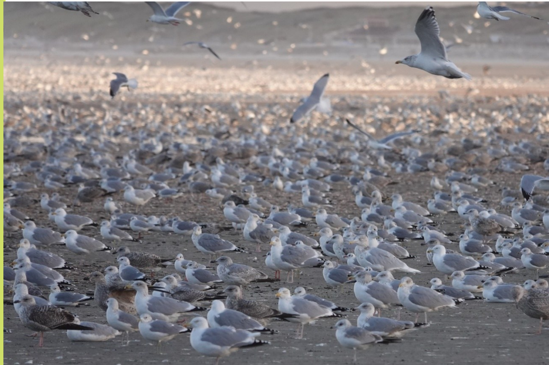
Zoek de adulte Grote Burgemeester tussen duizenden meeuwen op het strand van Velsen-Noord, 6 januari, foto Hans Schekkerman.

De eerste drie weken van december waren zacht en vaak somber, maar overwegend droog. Met de kerst begon een periode met winterse kou. Vanaf 3 jan viel er ook sneeuw in het binnenland, en vanaf de 7 e ook langs de kust, maar nauwelijks in onze regio. Op 12 jan viel de dooi weer in. Februari was droog, vrij zonnig en aanvankelijk vrij koud. In de derde week stond er een koude NO-wind; in Noord-Nederland viel ook sneeuw en ijzel maar bij ons opnieuw niet. Door een zacht einde kwam de gemiddelde maandtemperatuur toch uit op normaal. Het af en toe winterse weer bracht eigenlijk geen grote verplaatsingen van vogels in onze regio. Begin jan spoelden veel (meest lege) mesheften aan op het Velser strand; op 6 jan zaten meer dan 10.000 zilvermeeuwen en ca 2000 stormmeeuwen tussen de Noordpier en Wijk aan Zee.