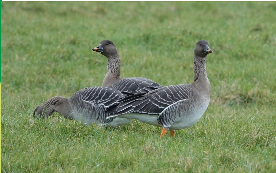
Toendrarietganzen, Castricumerpolder, 13 feb