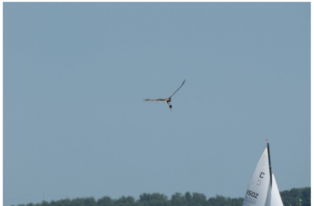
Bruine Kiekendief bij het Uitgeestermeer