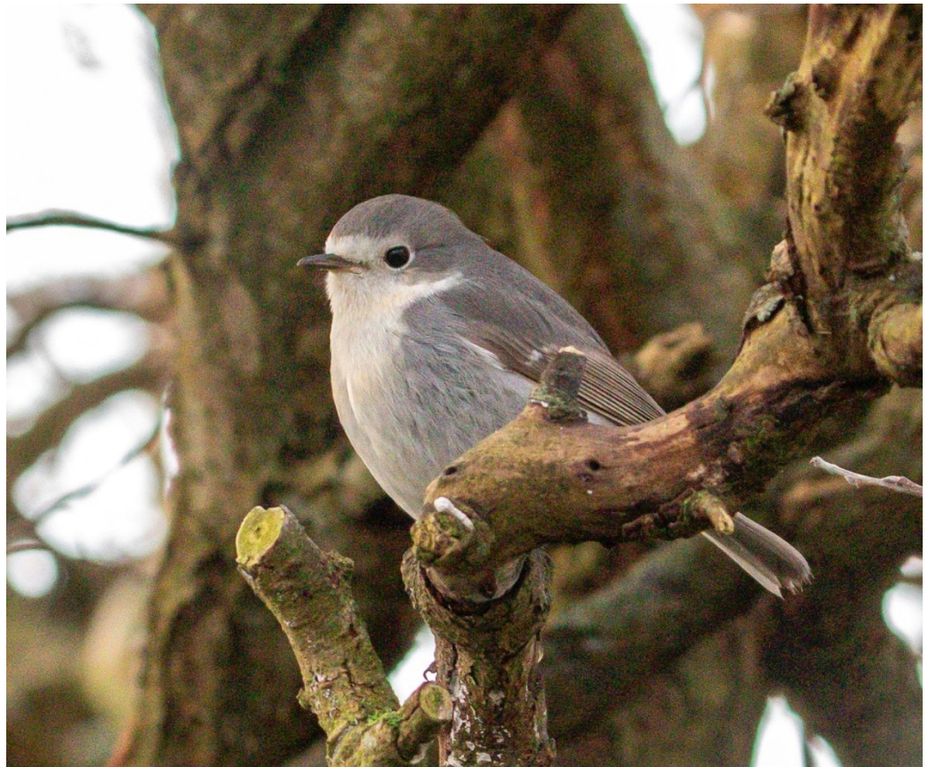
Roodborst in achtertuin Droogbloem Castricum, 18 januari 2026

Na wat zoeken op waarneming.nl ('roodborst', (levensstadium) 'afwijkend') en verder op internet werd wel duidelijk dat zo'n witborstige Roodborst beslist geen regelmatige verschijning is. Latere zoektochten in de buurt leverden ook niets meer op, totdat half januari een foto van Nelleke via Hans Stapersma en Hans Schekkerman rondging waaruit bleek dat de vogel in elk geval sinds eind november verbleef in het tuinencomplex twee blokken verderop achter Droogbloem in Castricum. Daar is deze bijzondere Roodborst nu al de hele winter een door de buurtbewoners geliefde gast die dankbaar gebruik maakt van de goed verzorgde wintervoeding daar.