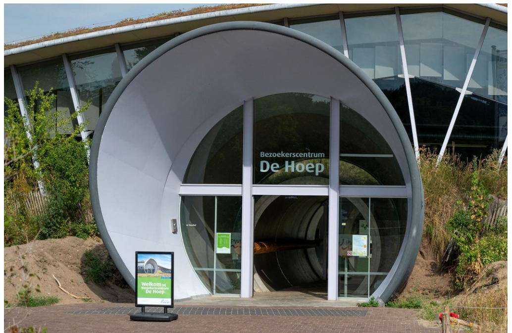
Bezoekerscentrum PWN De Hoep, Johannisweg 2 Castricum

De Nationale Vogelweek is van 9 tot en met 17 mei. Wij zoeken enthousiaste excursie-begeleiders. Geef je op bij Publieksactiviteiten - publieksactiviteiten@vwgmidden-kennemerland.nl