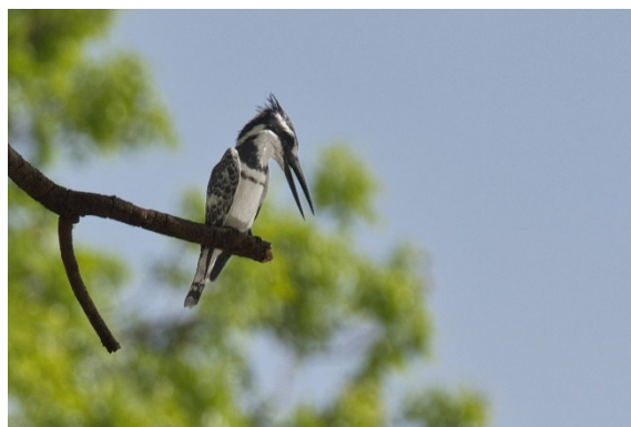
Pied Kingfisher – Bonte IJsvogel

Lang verhaal kort .... na te zijn gekomen van het idee, zijn we op internet gaan speuren naar eventuele negatieve reviews of andere gekke dingen over de gids, de organisatie en het land. We vonden niks dan enthousiaste verhalen en mooie vogelfoto's. Knoop doorgehakt, contact gezocht en geboekt voor half februari, 15 dagen langs de rivier De Gambia.