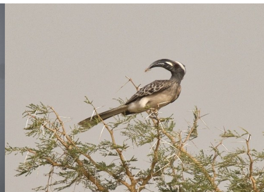
African Grey Hornbill – Grijze Tok