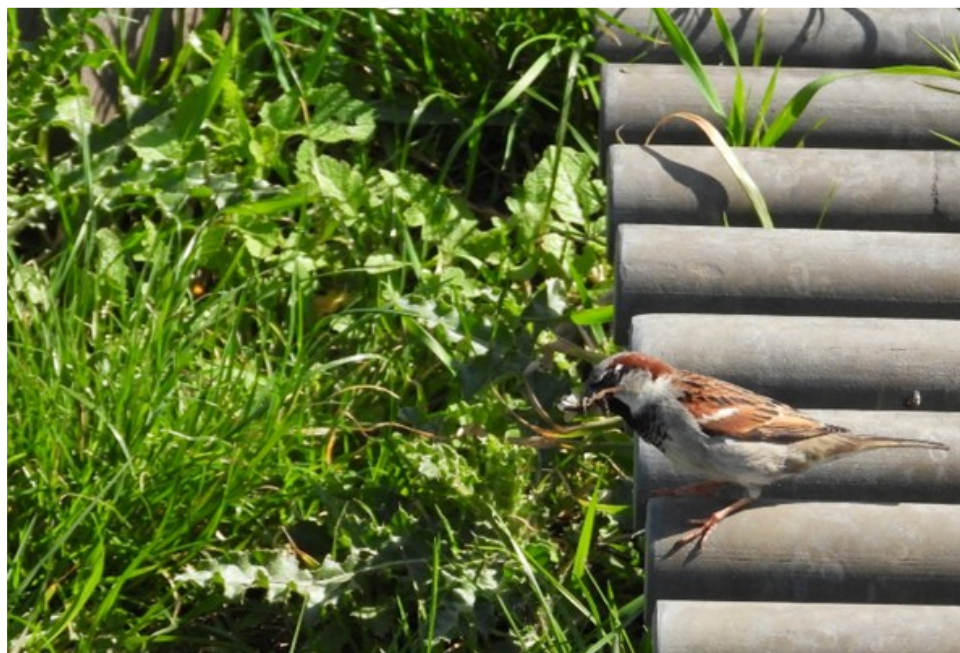
Doe mee met het Huismus-vriendelijk maken van onze omgeving