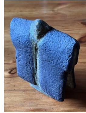
Foto: de Zilveren Maan prijs, onderscheiding voor belangrijk natuurbeschermingswerk in de provincie Noord-Holland

De Zilveren Maan is een dagvlinder die in ons werkgebied de afgelopen vijf jaar maar eenmaal is waargenomen. Zeldzaam dus, net als Arend de Jong, En daarmee mogen wij ons zeer gelukkig prijzen!