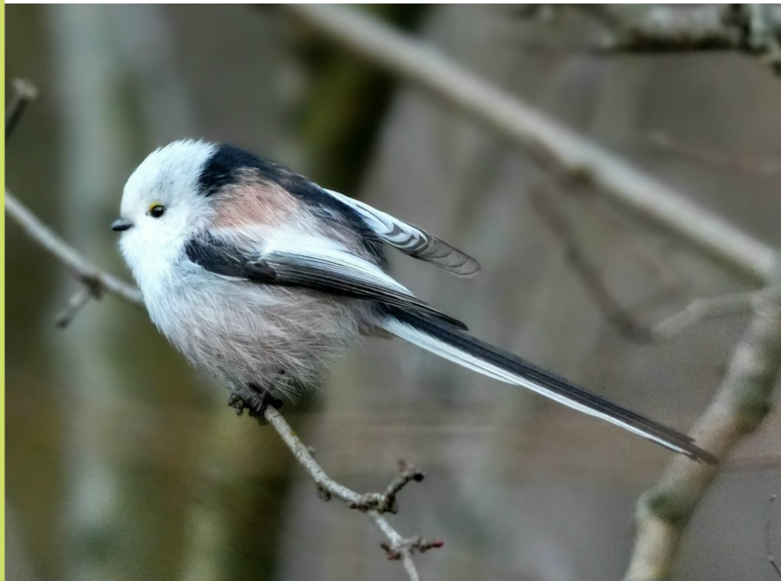
Witkopstaartmees, Beverwijk, 23 jan, foto Michel van Nieuwland

Een late Bruine Boszanger werd geringd op de Vinkenbaan op 17 dec en de enige Siberische Tjiftjaf van deze winter zat in een tuin in Limmen op de 27e.