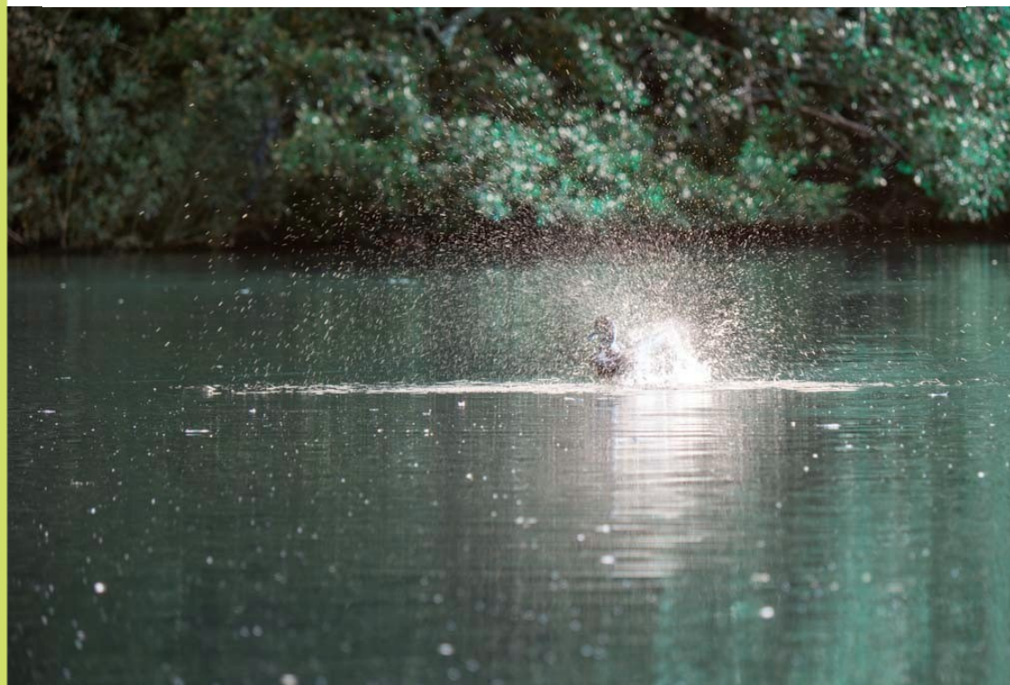
Waterballet in de Karpervijver

Een historisch perspectief: zo'n 50 jaar geleden waren we supertrots dat er af en toe Grauwe Ganzen bleven broeden in Nederland. En ook dit: we hebben de mond vol over het jagen in de landen om ons heen en roepen oehoe en ah over het schieten van Zomertortels in Frankrijk, het aanleggen van een vliegveld in Portugal op een plek waar nogal wat van "onze Grutto's" pleisteren, het vangen en eten van Ortolanen en spreken schande van de jacht op trekvogels in mediterrane landen.