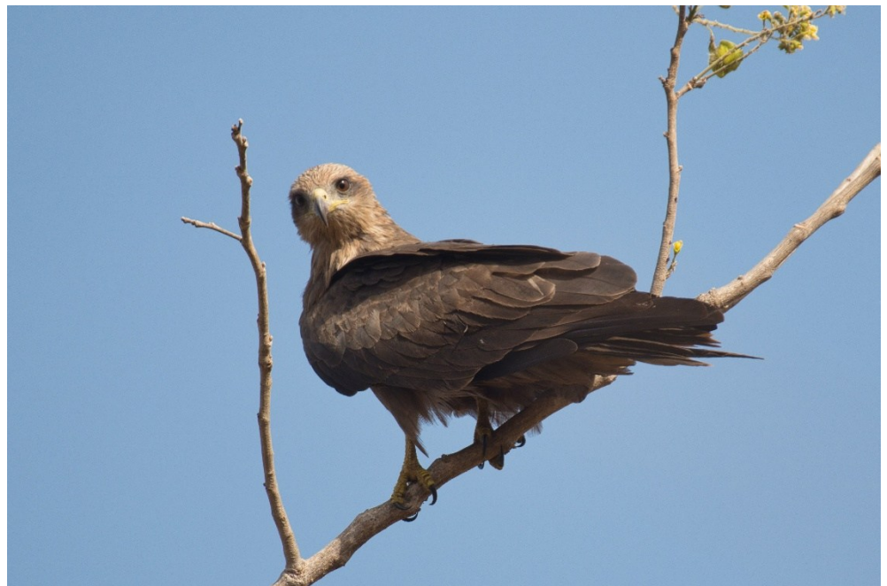
Yellow-billed Kite – Geelsnavelwouw

En de roofvogels. Wat was dat ook genieten. Zoveel beweging in de lucht, op de takken en op de grond. Zulke majestueuze vogels. En zoveel soorten. Uilen, arenden, wouwen, haviken, valken, gieren, enz. De wouwen waren ruimschoots in de meerderheid. Wat je dan krijgt na een paar dagen is dat je opgewonden roept dat je een roofvogel ziet, je de camera vast in gereedheid brengt, totdat de vogel dichterbij is en je ziet dat het een Wouw is, weer een Wouw is, en dan zeg je tegen elkaar, 'laat maar, het is een Wouw'. Onvoorstelbaar toch, dat er een roofvogelverzadiging optreedt.