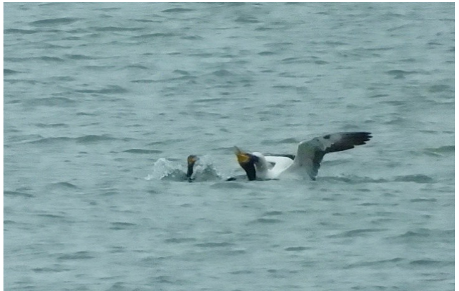
Foto onder : Jan van Gent doodt Aalscholver die vis in bek heeft.

Voedselnijd bij vogels is een vorm van agressief of defensief gedrag waarbij een vogel zijn voedsel, of de directe toegang tot voedsel, agressief verdedigt tegenover andere vogels of dieren.