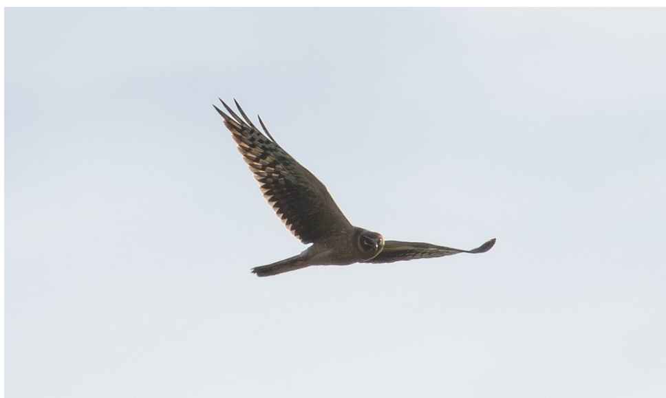
Steppekiekendief, Hempolder, 4 december

Er kwamen drie meldingen van Smellekens uit december en één uit januari. Velduilen werden maar weinig gezien deze winter: op 21 dec over zee bij Egmond en in jan-feb drie maal rond De Buitenlanden in de Wijkermeer.