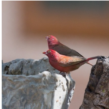
Red-billed Firefinch – Vuurvink

Langs de oevers van de rivier kwamen we ook vogels tegen die we hier zien: onder andere Wulpen, Steltkluten, Scholeksters, Reigers, Aalscholvers en Reuzensterns. Soms krek hetzelfde als in Nederland, soms met een exotisch tintje hier en daar.