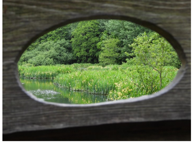
Zicht op de Karpervijver zoals ie was

4. Veel mensen attenderen mij op de grootschalige ingrepen van PWN rond de Karpervijver in Bakkum. Die waren ons bekend uit ons regelmatige overleg met de duinbeheerder PWN. Het gaat om het uitbaggeren van de vijver, het opruimen van een oude vuilstort, het "terugzetten" van de oeverbegroeiing aan de noordoostkant die groot en massaal was geworden en het vrijmaken van bomen van een hoofdtransportleiding voor water. Dat laatste is tegenwoordig beleid vanwege bereikbaarheid in geval van calamiteiten. Als laatste onderdeel van deze werkzaamheden wordt ook het kijkscherm aan de zuidoostkant vernieuwd. Wij zijn daar intensief bij betrokken en proberen met name de functionaliteit van het kunnen kijken naar vogels in de gaten te houden en te verbeteren. Er komen twee plekken waar ook mensen met rolstoelen terecht kunnen en ook aan fotografen wordt gedacht. Er gaat namelijk een ijsvogelwand komen schuin voor het nieuwe scherm; die voorziening gaan we in het najaar afmaken want nu moet het leemzand eerst goed inklinken. En nu maar hopen dat de IJsvogels dat ook een goede plek vinden!