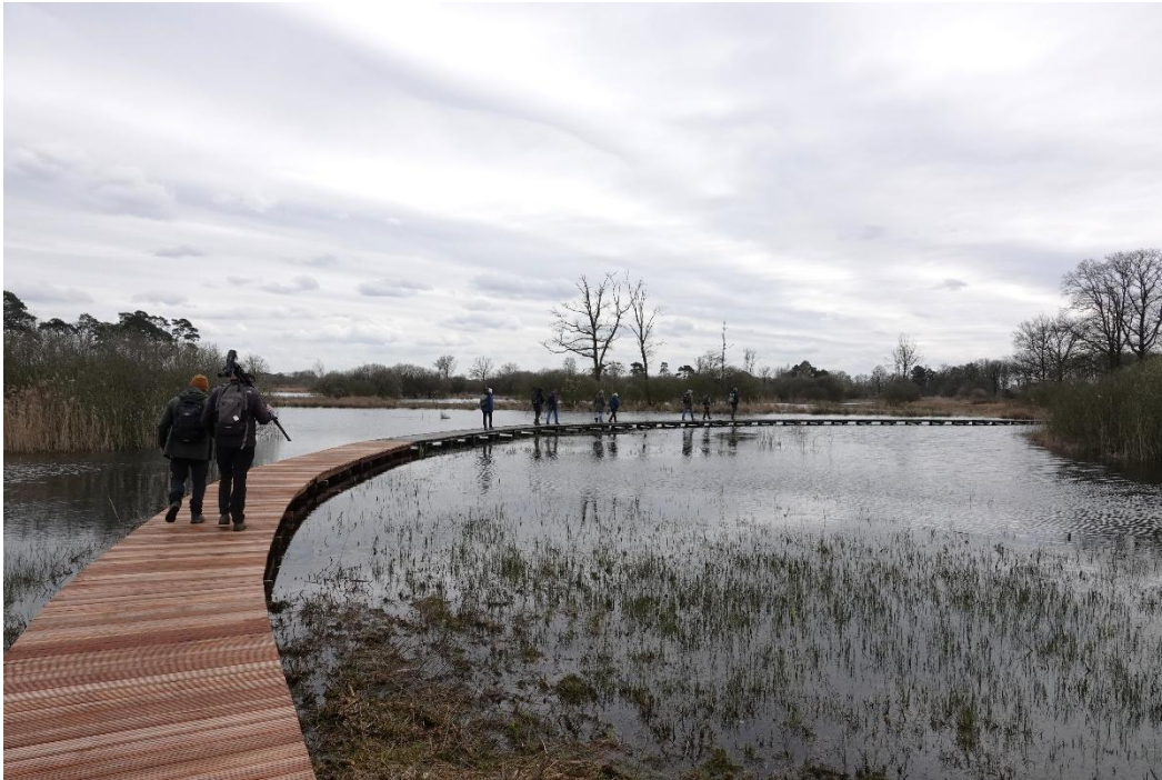
Wandelpad door de Empese en Tondense Heide.

Niet veel later hoorden we ook de Zwarte Specht. Het bleek zelfs een paartje met nest te zijn! Wat een cadeau! Het laatste deel van het rondje over het landgoed ging langs een weg waar we even lekker konden doorlopen, want van al dat slenteren en veel stilstaan word je stijf.