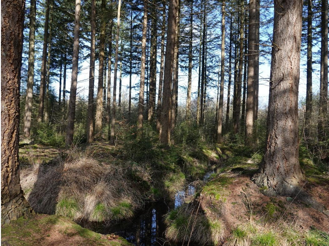
Rabattenbos.