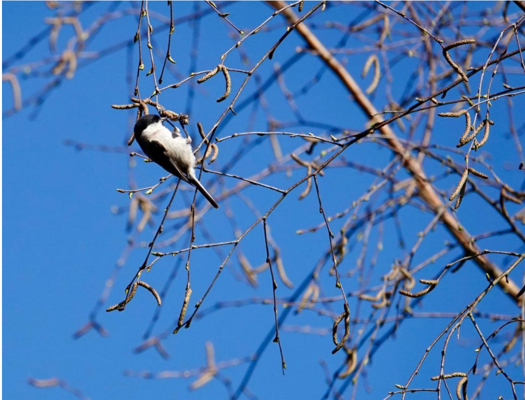
Glanskop; foto Sylvia Lok

Bij een stuk met sparren hoopten we op Kuifmees en Goudhaantjes, maar alleen de laatste liet zich horen. Toen kwam het stuk met de Middelste Bonte Specht. Deze liet zich al snel horen, maar keek nog een tijdje de kat uit de boom voordat deze (een mannetje) zich ook liet zien.