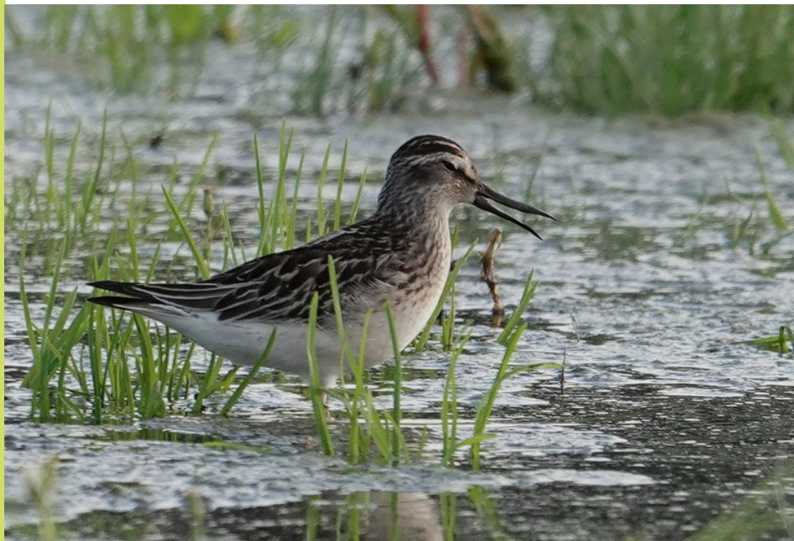
Breedbekstrandloper in de Bergermeerpolder, Bergen (NH)