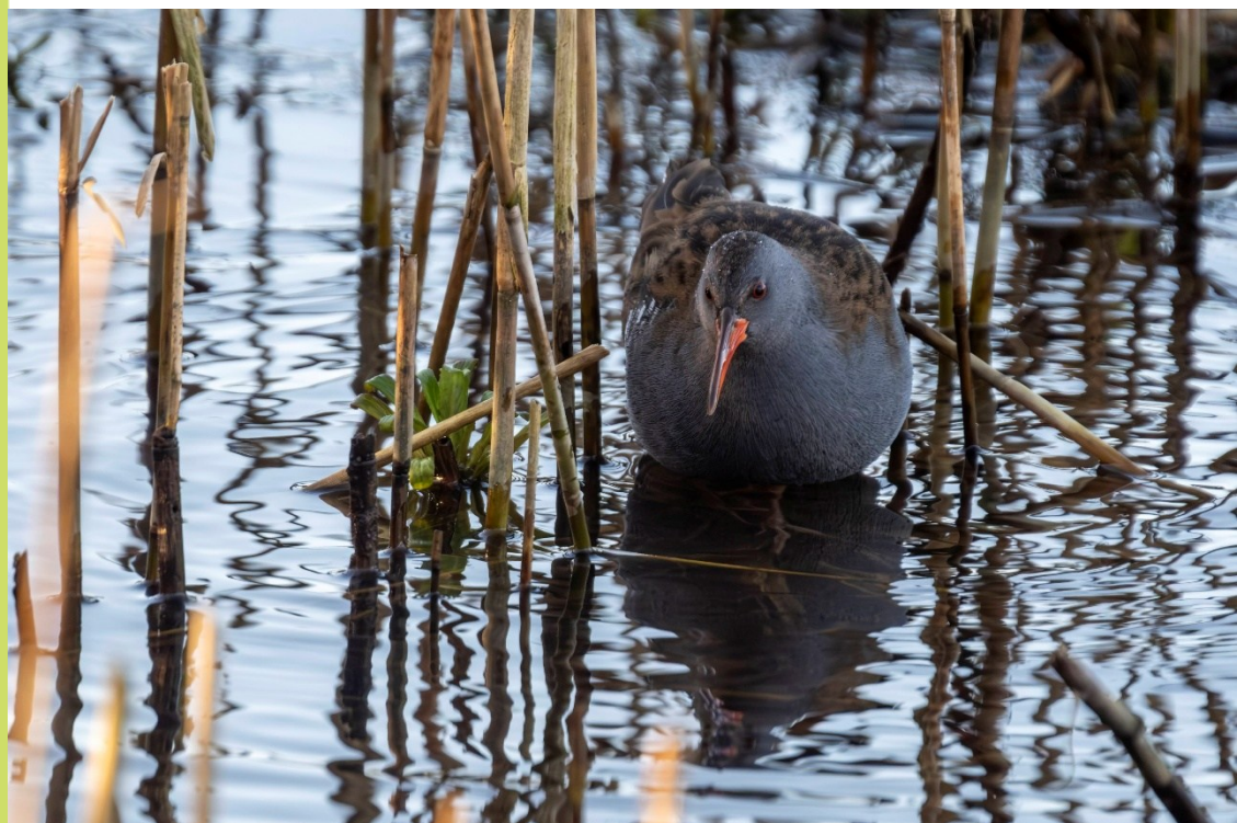
Waterral, Boetje van onze Kees