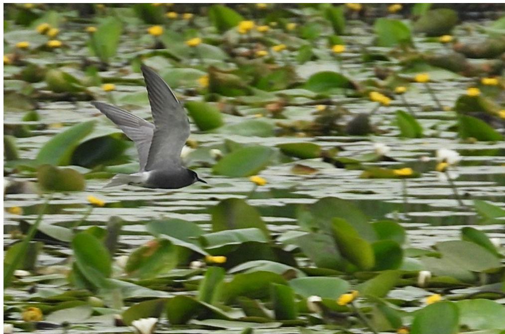
Zwarte Stern, Zouweboezem