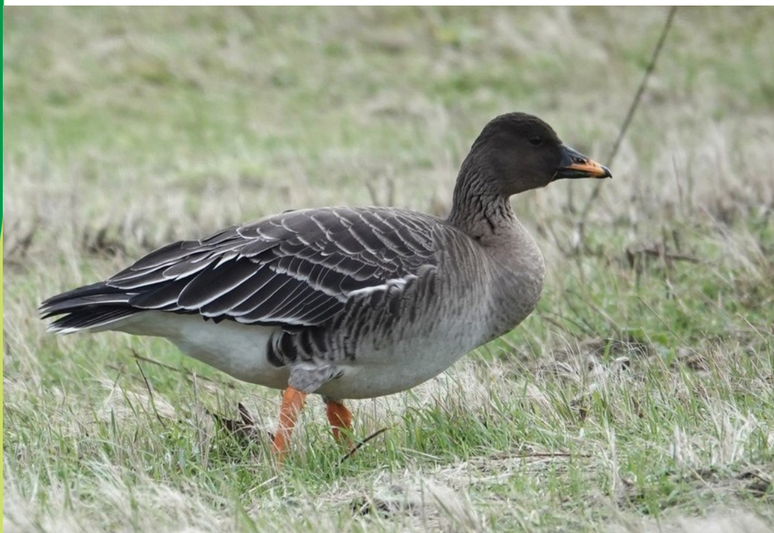
Toendrarietgans, Infiltratiegebied Castricum, 23 januari