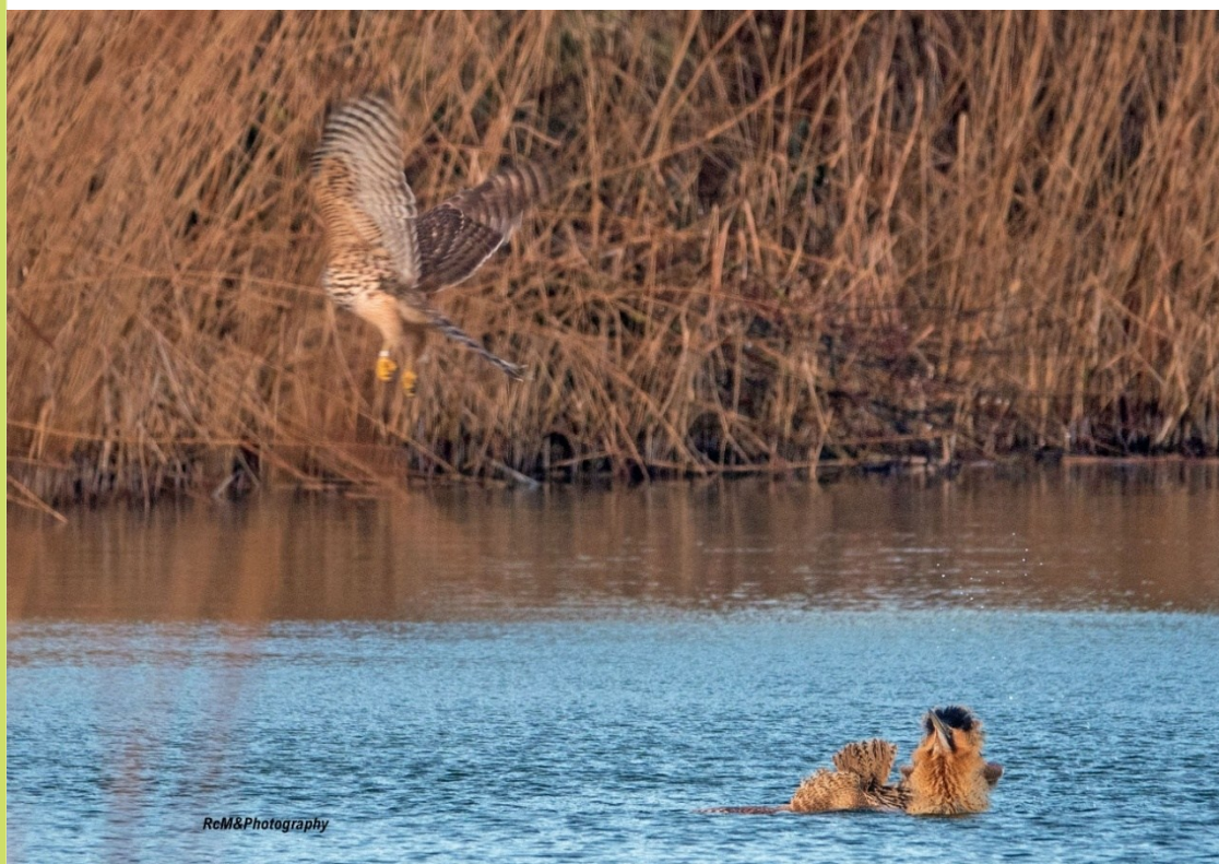
Havik valt Roerdomp aan

Onze keuze viel deze keer op een foto van Robert Moeliker, gemaakt bij het Hoefijzermeer. Een foto met een wel heel apart verhaal: een juveniele Havik valt Roerdomp (in het water) aan. Robert is een bevoegen vogelfotograaf die graag en vaak te vinden is in het Boetje van onze Kees in het Infiltratiegebied Castricum.