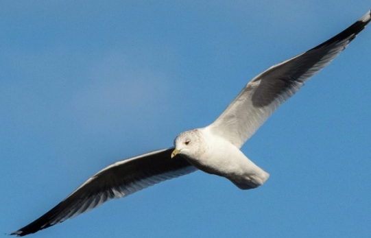
Stormmeeuw, Wormer- en Jisperveld