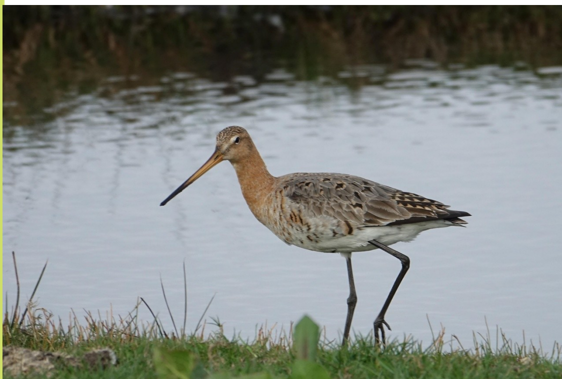
We besluiten deze Winterkoning in stijl met een mooie foto van een Grutto van Radha van Schaijck en een foto van een alerte Kleine Zilverreiger van Bart Romijn.

We moesten het deze winter nagenoeg zonder Barmsijzen doen (1 ex op 11 jan en 2 exx op 3 feb, NHD Bakkum), en zelfs helemaal zonder Kruisbekken. Ook Sneeuwgorzen waren niet talrijk met vijf meldingen van maximaal 4 exx tussen 4 dec en 11 jan. Er waren 6 waarnemingen van Waterpieper , in de polders van Beverwijk, Limmen en Castricum-Heemskerk. Deze soort is 's winters in de kustnabije polders opvallend veel schaarser dan verder het binnenland in (o.a. Zaanstreek). Overwinterende Zwarte Roodstaarten werden gemeld uit Castricum (Castricummerwerf), Beverwijk (haven) en Uitgeest (dorpskerk). De enige Siberische Tjiftjaf werd op 1 dec geringd op de Vinkenbaan. Ook de enige meldingen uit deze verslagperiode betroffen een Raaf vliegend over de A9 bij Heemskerk op 2 dec, en een Klapekster in het Vogelduin, NHD Bakkum, op 11 jan.