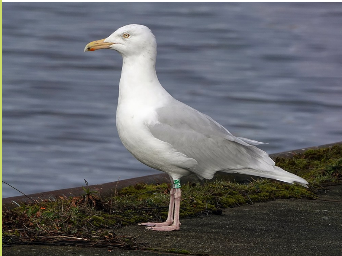
Grote Burgemeester, Beverwijk, 23 februari

Op het aangespoelde zeebanket bij de Noordpier foerageerden vanaf half december naast enige duizenden Zilvermeeuwen ook tot maximaal 20 Pontische Meeuwen. Van deze soort werden 60 waarnemingen ingevoerd, optellend tot ten minste 275 vogeldagen.