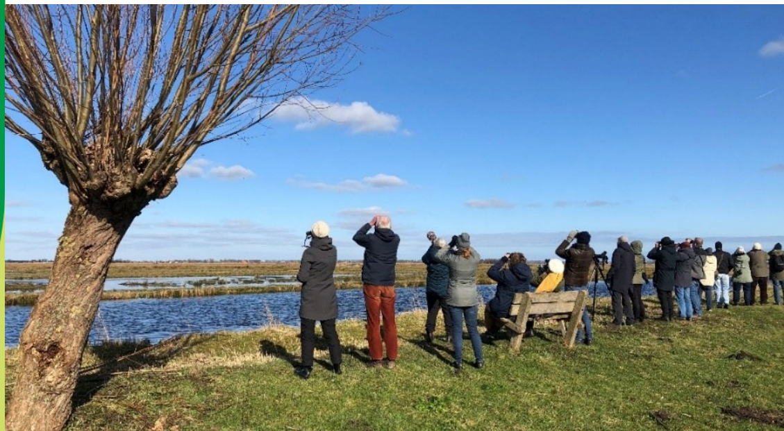
Uitzicht op het Wormer- en Jisperveld