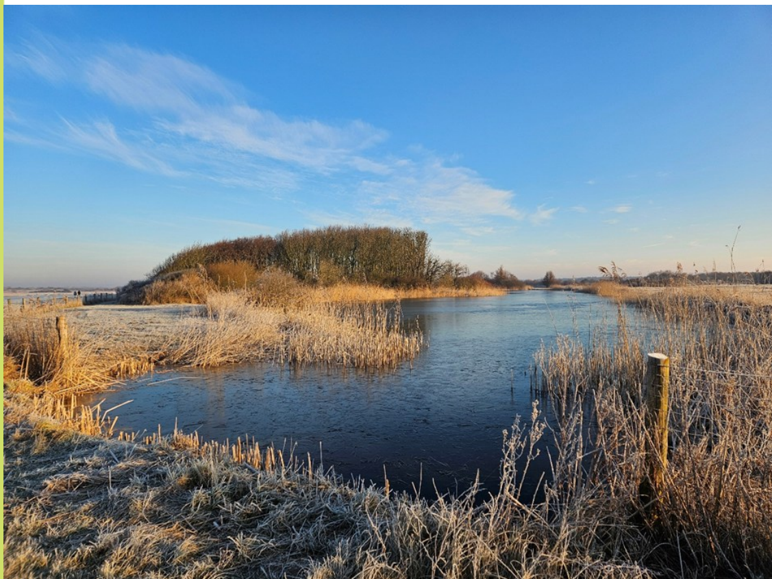
Infiltratiegebied Castricum