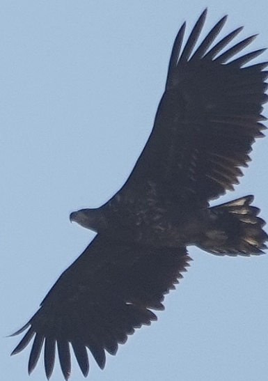
Zeearend, NHD Castricum, 16 februari. De afwisseling van lange spitse juveniele armpennen en kortere en ronde geruide pennen verraad de leeftijd als 3kj.

Op 1 feb werd een Zeearend gemeld langs de A9 bij de St.-Aagtendijk, Heemskerk en op 7 feb vloog er een over De Westert, NHD Egmond. Op 16 feb passeerden zelfs 2-3 Zeearenden onze regio: 's morgens een 2kj naar N door het duinterrein, en 's middags vrijwel tegelijkertijd exemplaren over de Limmerpolder (en even later Castricum) en de Heemskerk Noordbroek