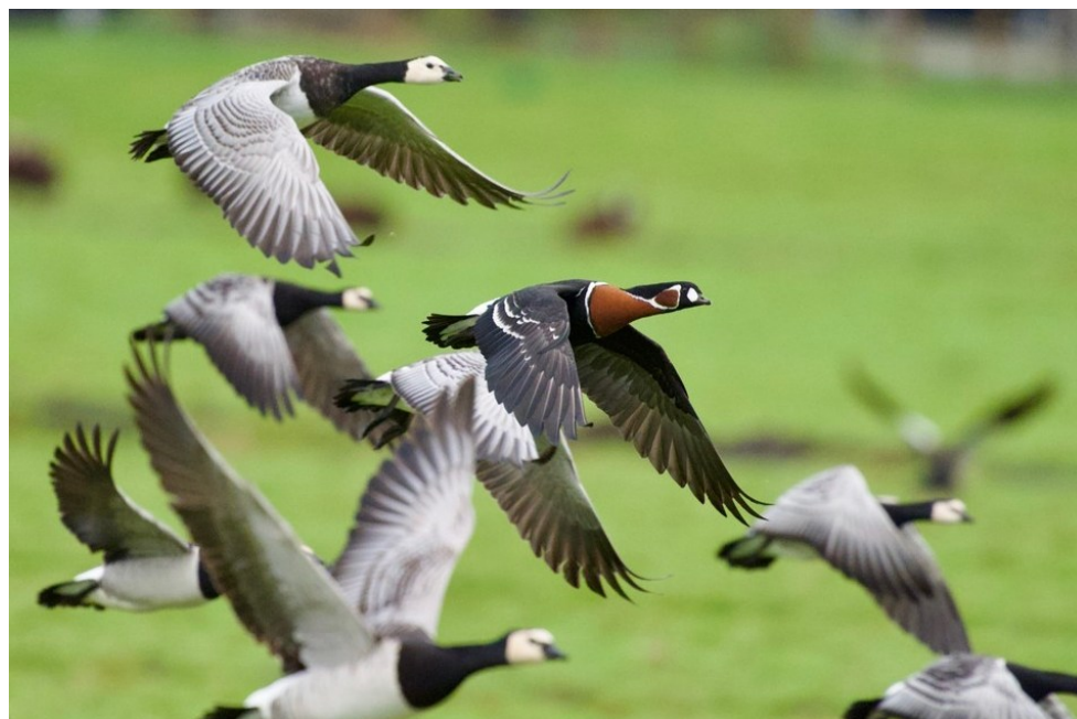
Roodhalsgans en Brandganzen, Akersloot, 10 januari

Het was weer een zachte winter met nagenoeg geen vorst. December 2024 was een grijze maand met af en toe veel wind. Ook januari was vrij somber en nat, met een mistige periode rond het midden van de maand. Februari was droog, aan de zonnige kant en met een normale temperatuur. Vanaf 11 dec spoelden flinke banken met zeesterren en nog levende schelpen aan op het strand, vooral bij de Noordpier, en dat zorgde tot begin januari voor een rijke dis voor meerdere duizenden (vooral Zilver)meeuwen. Dit was ook meteen zo'n beetje de enige min of meer bijzondere omstandigheid die zich deze winter voordeed, voor de rest was het op vogelgebied een tamelijk 'saai' wintertje, wat te merken is aan de lengte van deze rubriek.