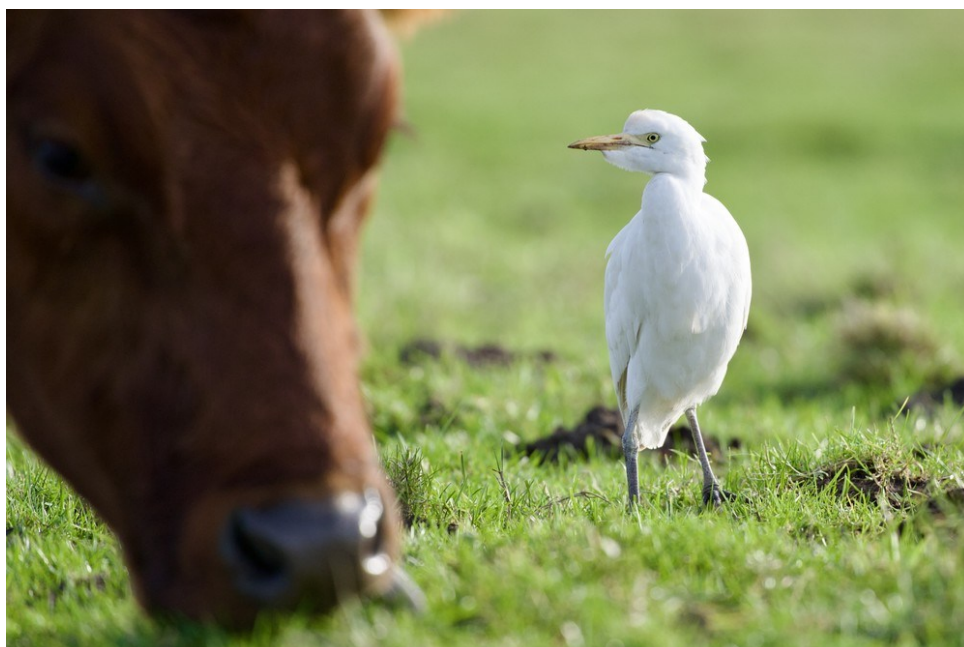
Koereiger, Heemskerk, 26 januari