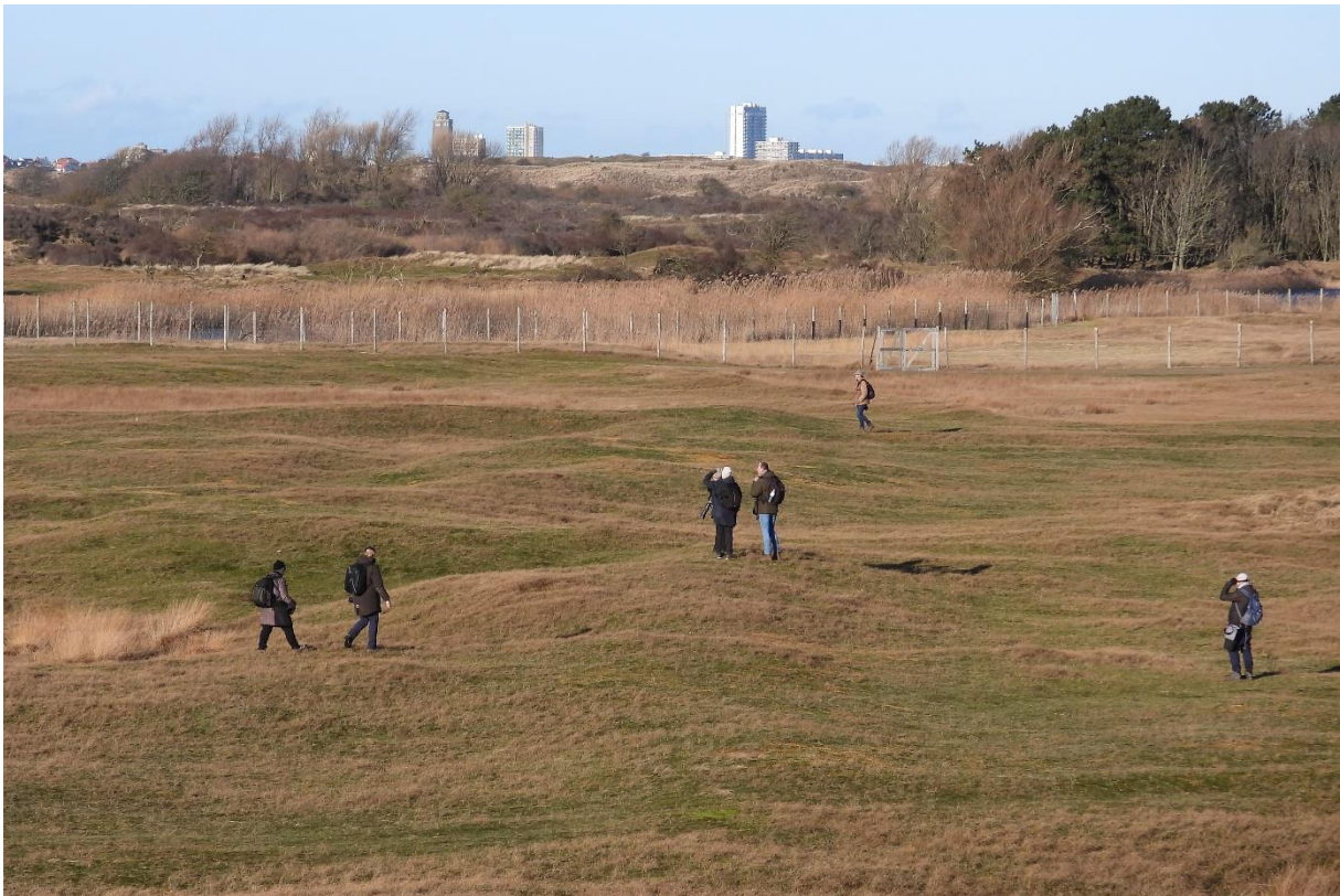
Op zoek naar de Taigaklapekster (Bart Romijn)

De fotograaf stoorde mij, maar hij verstoorde niet per se de vogels. Dat gebeurt ook regelmatig; te vaak. Een paar maanden later, eveneens in de Amsterdamse Waterleidingduinen, kom ik een bekende tegen en vraag ik hem of hij wat voor bijzonders heeft waargenomen. Hij antwoordt: "Hier verderop in het riet liet een Waterral zich mooi zien. En de Klapekster, maar die wordt de hele tijd opgejaagd door vogelaars en fotografen." Zowel de Klapekster als verstoring wil ik zien en zoek een heuvel van waaruit ik goed zicht heb op het gebied. Er lopen diverse groepjes mensen in een bepaalde richting.