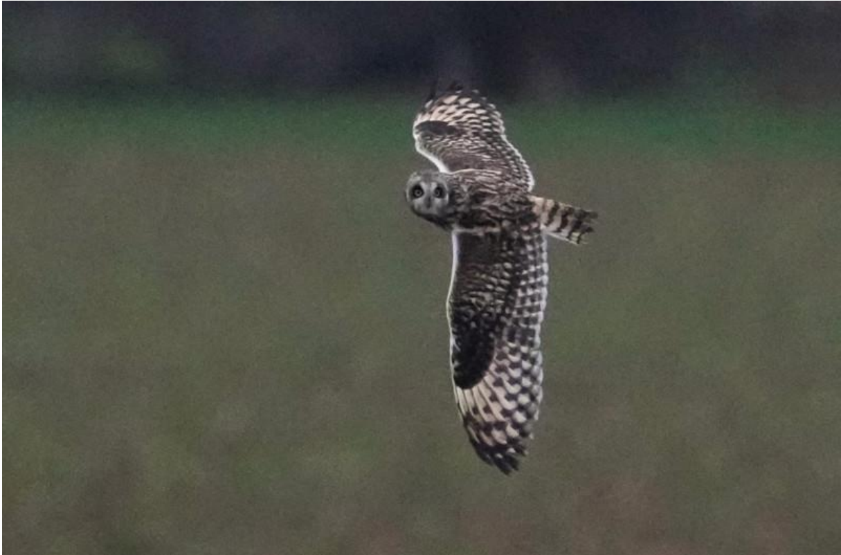
Velduil, Wijkermeerpolder, 14 februari (Hans Stapersma)