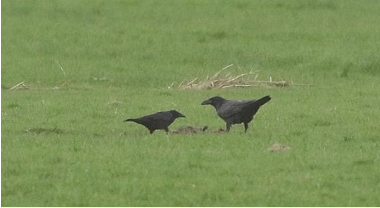
Raaf (r) en Zwarte Kraai bij dode Haas, Castricumerpolder, 25 januari (Hans Groot)