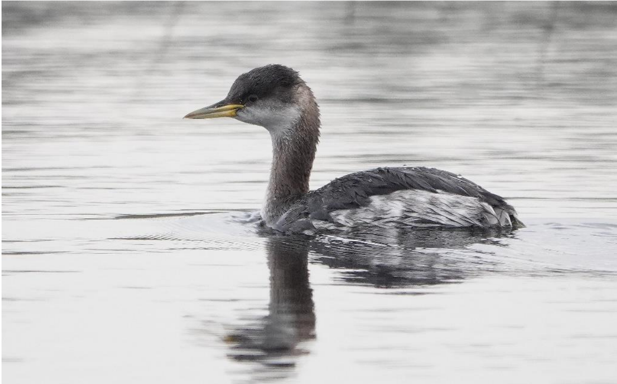
Roodhalsfuut, Watervlak, 25 januari (Hans Schekkerman)