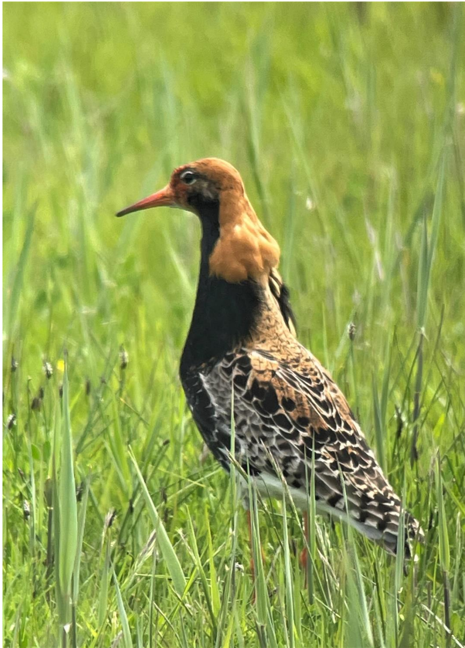
Kemphaan (Hans Stapersma)

De volgende twee artikelen gaan over de broedende Kemphaan. Het eerste is een anekdotisch-historische beschrijving van een nest van de Kemphaan in de Castricummer polder. Het sluit af met de hoop dat we met natuur-inclusief boeren we de broedende Kemphaan weer terugkrijgen. Het tweede artikel stelt dat er meer nodig is dan 'natuur-inclusief boeren. Wij delen dat inzicht, zeker gezien de huidige ontwikkelingen zowel in het agrarisch gebied als in de politiek. Op zijn minst is een rigoureuze natuurbeschermingsaanpak nodig, en zelfs dat biedt geen zekerheid. Maar, zoals de laatste auteur stelt, zeg nooit nooit!