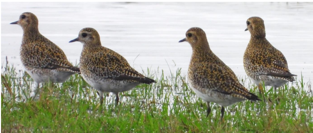
Goudplevieren, 's winters in groten getale aanwezig in de Castricumerpolder (Bart Romijn)

De Winterkoning is het Verenigingsblad van de Vogelwerkgroep Midden-Kennemerland. De werkgroep kent naast het bestuur en de redactie diverse werkgroepen. Kijk hier voor een overzicht met contactgegevens .