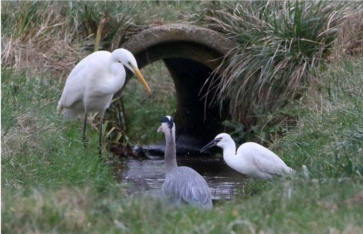
Grote en Kleine Zilverreiger en Blauwe Reiger, De Westert, 12 januari (Hans Groot)