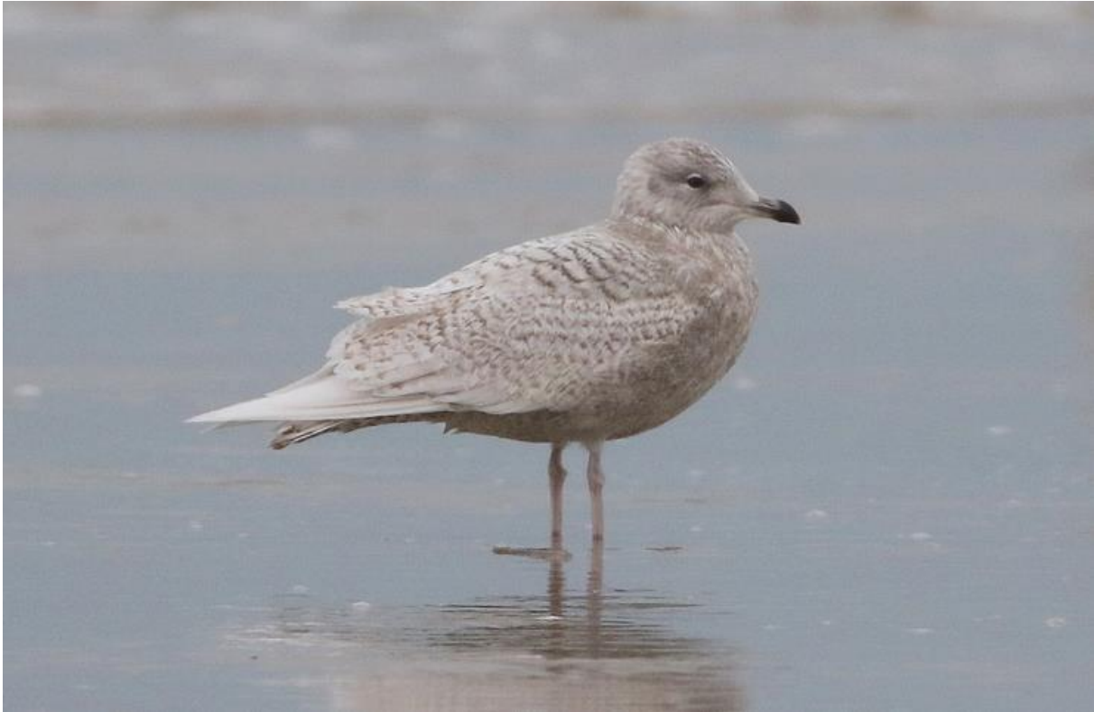
Kleine Burgemeester 2 kj, strand Egmond, 19 januari (Hans Groot)