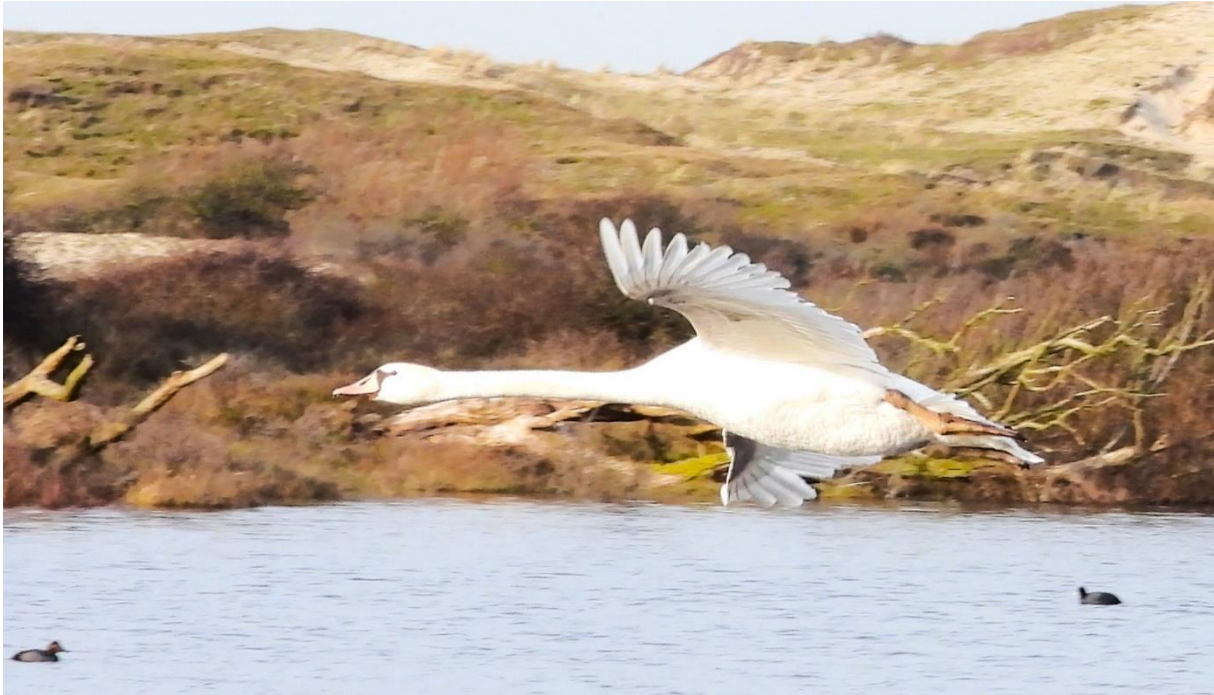
Knobbelzwaan, Starrevlak (Bart Romijn)

Naast de lezingen vonden geslaagde excursies plaats naar Texel en Marquette. De excursie naar het Starrevlak bij Egmond ging vanwege slecht weer helaas niet door. Kijk voor de verslagen hier op de website.