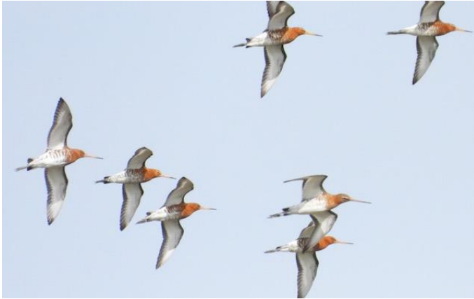
Vliegshow van IJslandse grutto's

Op onderstaand kaartje is de route schematisch, met dank aan Komoot, aangegeven.