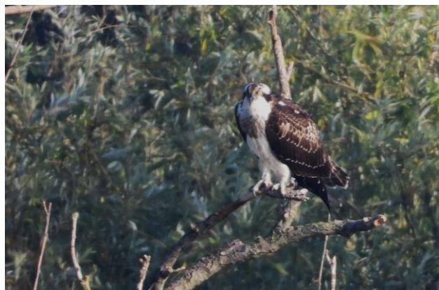
De Blauwe Kamer, uitzicht op Kleikuil en Visarend.