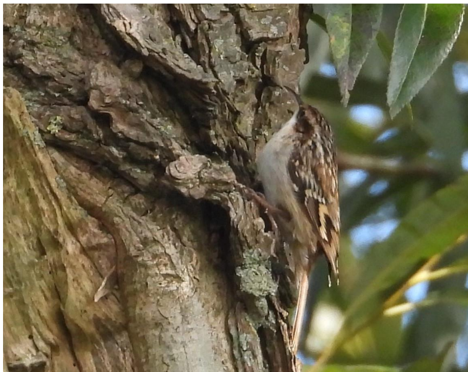
Boomkruiper, De Blauwe Kamer.

Vanaf de hut maken we een mooie wandeling door de uiterwaarden naar de Rijn. We zien zwermen met Spreeuwen, een Ekster, Grauwe Ganzen en een Soepgans ,die tegenwoordig Parkgans wordt genoemd. Puttertjes, Vinken, Pimpelmeesjes (ook mooi voor de fotografen) en de Boomkruiper; wat een mooie camouflage heeft die vogel!