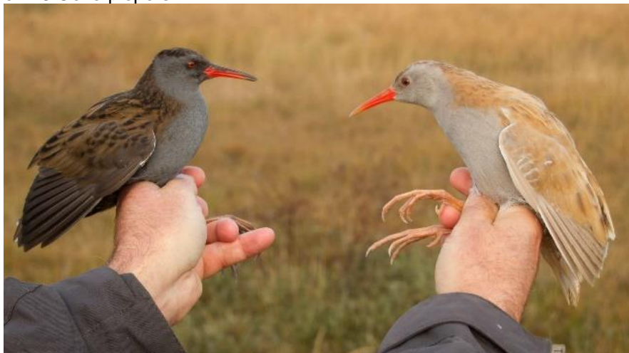
Foto "diluted" waterral: 2 adulte vrouwen Waterral, een exemplar met de mutatie Bruin: "Onvolledige oxidatie van het eumalenine recessief en geslachtsgebonden dus dit individu moet een vrouw zijn" – pers. comm. Hein van Grouw

Verdere hoogtepunten: Dwerggors (6 okt), Raddes' Boszanger (12 okt), Siberische Tijf (16 okt), Spreeuw met een ring uit Litouwen (17 okt), 1 Geelgors, 29 Bladkoninkjes, 575 Goudhaantjes, 3 Baardmannetjes, 1524 Roodborsten, 1 Zwarte Roodstaart, 2 Boomleeuweriken, 15 Waterpiepers en 16 Oeverpiepers.