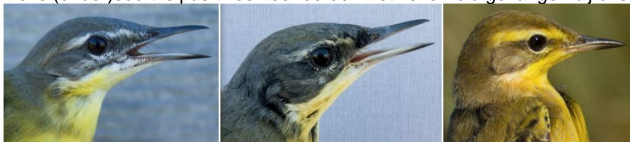
Foto: Gele Kwikstaarten (Tim van der Meer & Jan Visser): portretten van Motacilla flava flava , M. f. thunbergi en M. f. flavissima

flavissima ) ging, deze hebben een gele wenkbrauwstreep, maar dit is voornamelijk duidelijk bij vermoedelijk jonge mannetjes. Dit was tevens een nieuw jaarrecord voor deze (onder-)soort. De hoofdmoot van de Gele Kwikstaart-vangsten zijn eerstejaars. Adulte Gele Kwikstaarten werden weinig gevangen, maar één van de adulte vogels die werd gevangen op 24 augustus viel direct op door zijn donkergrijze kruin en nog donkerdere wang. Een adulte man Noordse Gele Kwikstaart ( Motacilla flava thunbergi ) dus! Deze (onder)soort is pas twee keer eerder met zekerheid gevangen bij ons.