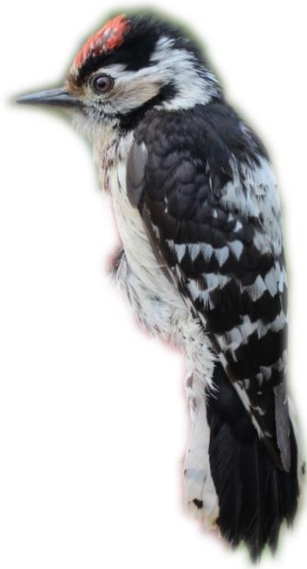
Kleine Bonte Specht