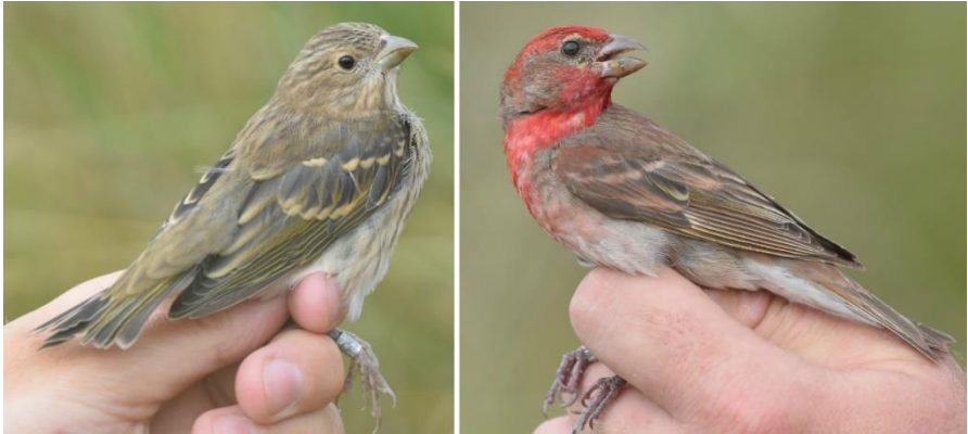
Foto Roodmussen (Vincent van der Spek): juveniel en adult man Roodmus